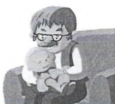
Le papi porte le bébé.