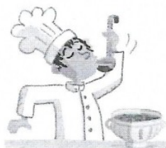
Le chef goûte la soupe.