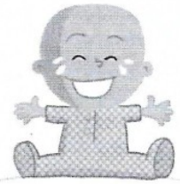
Le bébé rit.