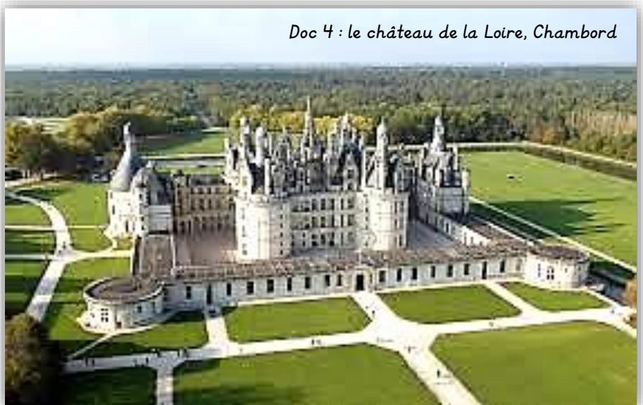
Doc 4 : le château de la Loire, Chambord

Le château de Chambord, construit sous François I er , comprend 440 chambres et 365 cheminées. Le parc comprend aujourd'hui 5 500 hectares de bois fermés par un mur de 32 kilomètres de long.