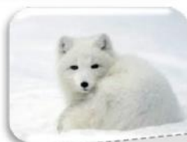
Isatis ou renard polaire