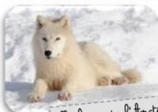
Le loup de l'Arctique